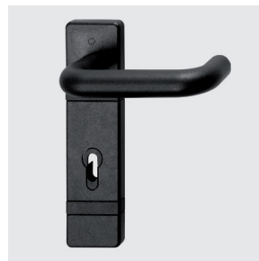
Maniglia M1R in plastica nera

La confezione maniglia M1R è composta da: una coppia di maniglie a leva in plastica nera, una coppia di copriplacche in plastica nera con foro per chiave tipo patent modificabile per montare il cilindro europeo, il quadro 9 x 9 lunghezza 125 mm, le viti di fissaggio ed i distanziali.