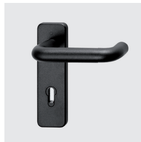
Maniglia M1 in plastica nera

La confezione maniglia M1 è composta da: una coppia di maniglie a leva in plastica nera con anima metallica e sottopacche in acciaio zincato, una coppia di copriplacche in plastica nera con foro per chiave tipo patent modificabile per montare il cilindro europeo, il perno quadro 9 x 9 lunghezza 125 mm, le viti di fissaggio ed i distanziali. La confezione contiene anche le chiavi esagonali per la regolazione delle cerniere ed il nottolino fermamolla.