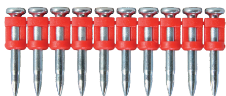
Chiodi XHA di alta qualità per chiodatrice a gas FORCE ONE