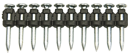
Chiodi TKA standard per chiodatrice a gas FOX