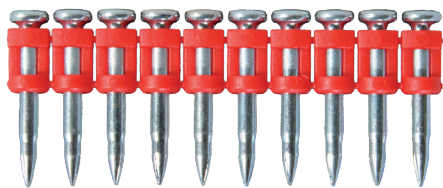
Chiodi XHA di alta qualità per chiodatrice a gas FOX