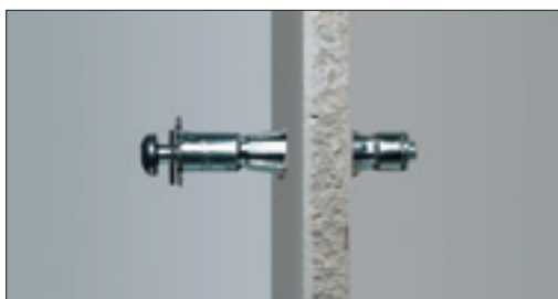
2. Inserire l'ancorante nel foro, fino a che la testa dell'ancorante non abbia raggiunto il pannello