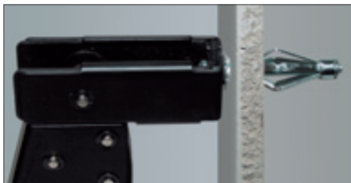
3. Svitare leggermente la vite, per una porzione sufficiente all'inserimento della testa della vite nello speciale utensile (serie HQ); quindi azionare l'utensile a pistola, fino ad ottenere l'apertura a "stella" dell' ancorante.