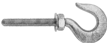
Gancio forgiato classe 4.8 FIS A RH