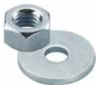
Dado esagonale MU e rondella U