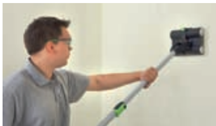
La regolazione di profondità consente di proteggere il fondo.

Il nuovo FAKIR è aggressivo sulla carta da parati ma delicato sulla parete. Infatti, poiché le carte da parati non sono tutte uguali, la profondità di penetrazione dei rulli deve essere regolata di volta in volta. Ciò evita che il fondo si danneggi. Il principio di funzionamento rivoluzionario riduce la forza necessaria rendendo FAKIR l'utensile perfetto per gli ambienti alti.