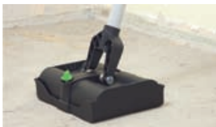
La cappa di protezione per un trasporto sicuro e pulito.