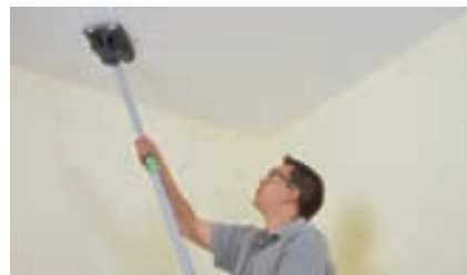
Soffitti e pareti alti? Nessun problema, grazie all'asta telescopica.