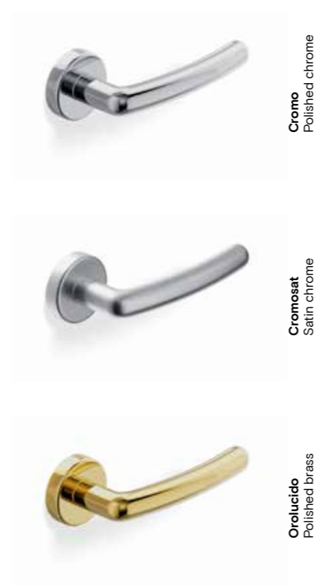
Cromo Polished chrome