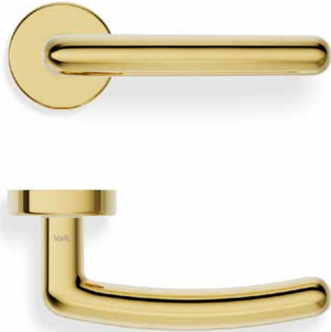
Maniglia porta / Door handle