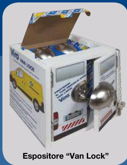
Espositore “Van Lock”

Corpo: monoblocco in acciaio inox elettrolucidato, di forma ellittica, privo di spigoli.