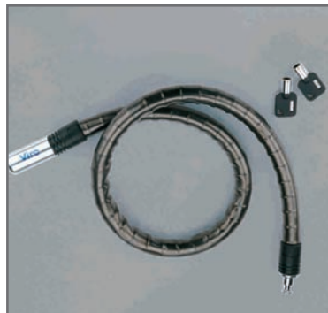
Chiavi con impugnatura ergonomica