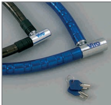
Ricopertura in pvc antigraffio