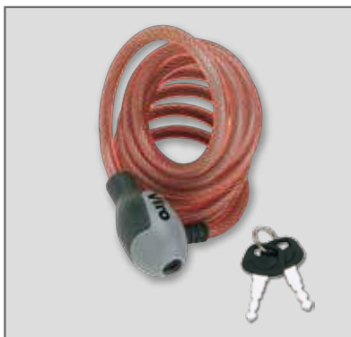
Chiavi con impugnatura ergonomica