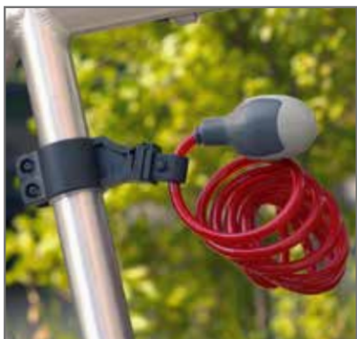
Dotati di supporto di fissaggio